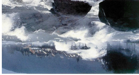
Der grösste Sturm der Schweiz war Lothar

Der grösste Kanton der Schweiz ist der Kanton Graubünden. Der kleinste Kanton der Schweiz ist der Kanton Basel-Stadt.